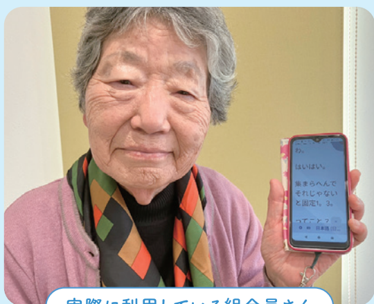
実際に利用している組合員さん

最近、「耳が遠くなって聞き返すのが増えた」「補聴器を使っても会話についていけない」と感じていませんか。また、ご家族の中に「最近、会話が減ったな」と心配している方はいませんか。年齢とともに、耳が遠くなるのは自然なことです。でも、会話をあきらめる必要はありません。今は、スマートフォンの力を借りて、会話を文字で見ることができます。耳ではなく“目”で会話に参加する方法をご紹介します。